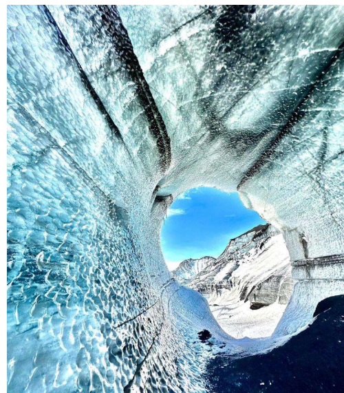
Katla Ice Cave